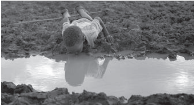
Ein Kind trinkt verschmutztes Wasser aus einer Pfütze in einem beinahe ausgetrockneten Flussbett in Turkana County